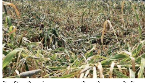
शेत पिकांचे प्रचंड नुकसान झाले आहे. ज्यामुळे शेतकरी हवालदार झाला आहे. निसर्गाने देखील अनपेक्षितपणे अवकाळी पावसाचा कहर करत बीडकरांना एक प्रकारे एप्रिल फुलच केल्यासारखे नव्हे तर वास्तव सत्य नुकसानग्रस्त वातावरण झाले आहे.

आर्थिक नियोजनाची घडी बसवण्यात आकडेमोड करण्यात व्यस्त असताना दुसरीकडे अवकाळी पावसाने अचानक डोके वर काढण्यास सुरुवात केली. यानंतर १ एप्रिल रोजी सकाळी उन्हाणे आपला पुन्हा कहर सुरू केला. प्रचंड गर्मी होत असतानाच अचानक सायंकाळी चार वाजण्याच्या दरम्यान वातावरणात बदल सुरू झाला आणि पावसाळ्याला देखील लाजवेल अशा प्रकारे विजेच्या कडकडाटामध्ये ढगाफुटी सदृश्य पावसाने हजेरी लावण्यास सुरुवात केली. आतापर्यंतच्या इतिहासातील अवकाळी पावसाचा हा उच्चांक कदाचित ठरेल इतका जोरदार पाऊस झाला. रात्री उशिरापर्यंत अवकाळी पावसाचा कहर सुरू होता. या अवकाळी पावसामुळे बीड जिल्ह्याचे किती नुकसान झाले आहे याचा अंदाज आज समोर येईल. मात्र या अवकाळी पावसात