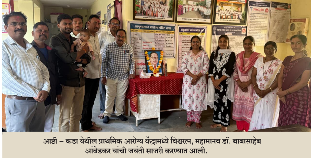
आष्टी - कडा येथील प्राथमिक आरोग्य केंद्रामध्ये विश्वरत्न, महामानव डॉ. बाबासाहेब आंबेडकर यांची जयंती साजरी करण्यात आली.