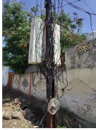
वायर मध्ये सेलो टेप' किंवा 'ब्लॅक टेप' लावून जुळवण्यात आल्या

परिसरातील विद्युत तारांची अवस्था अत्यंत दयनीय झाली आहे. अनेक ठिकाणी तारा तुटलेल्या असून त्या केवळ 'जोडून घेतलेला आहे तसेच मीटर मधून आलेले