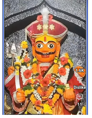
होगार आहेत.खंडीबा हे घुंगर्डे हादगावकांचे ग्रामदैवत असल्यामुळे, मुंबई, पुणे, नाशिक,संभाजीनगर, अहिल्यानगर आदी शहरात नोकरी-व्यवसायांनिमित्त स्थायिक झालेले ग्रामस्थही या यात्रेसाठी खास गावाकडे येतात. गावात प्रत्येक घरातून भाविक दर्शनासाठी हजेरी लावत असल्याने यात्रेला एके वेळेचे सांस्कृतिक आणि धार्मिक महत्त्व प्राप्त झाले आहे.

घुंगर्डे हादगाव प्रतिनिधी अंबड तालुक्यातील घुंगर्डे हादगाव येथे गल्हाटी नदीकाठी वसलेल्या खंडीबा मंदिरात येत्या ६ एप्रिलपासून वार्षिक यात्रेला सुरुवात होत असून, दोन दिवस चालणाऱ्या या धार्मिक सोहळ्यासाठी परिसरात उत्साहाचे वातावरण निर्माण झाले आहे. चैत्र पंचमी निमित्त भरविण्यात येणाऱ्या या यात्रेसाठी घुंगर्डे हादगावसह आसपासच्या गावांमधून हजारो भाविक उपस्थित राहणार असून नवसाला पावणारा देव म्हणून प्रसिद्ध असलेल्या खंडीबाच्या दर्शनासाठी भाविकांची मोठी गर्दी अपेक्षित आहे.