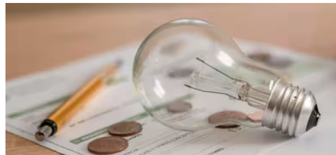
असला तरी प्रत्येक महिन्याला निश्चित स्वरूपात आकारला जातो. आता हा निश्चित शुल्काचा हिस्सा वाढवण्याचा प्रस्ताव समोर आला आहे. हा प्रस्ताव लागू झाल्यास कमी वीज वापरणाऱ्या ग्राहकांनाही मोठा

घर कायमच बंद असलं तरी भरावं लागणार वीज बिल, 'हा' प्रस्ताव लागू झाला तर खिशाला भुईद