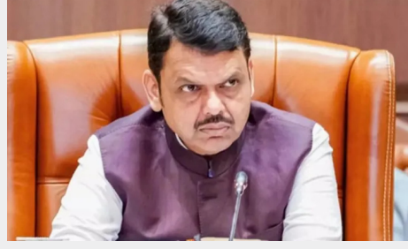
केंद्र उभारणे, भंडारा डोंगर परिसरात हरित क्षेत्र संवर्धन, वृक्षारोपण आणि नैसर्गिक सौंदर्य अबाधित ठेवण्यासाठी उपाययोजना करण्यात याव्यात, असे निर्देश फडणवीस यांनी दिले. किळे अजिंक्यतारासाठी १३४ कोटी सातारा जिल्ह्यातील ऐतिहासिक किळे अजिंक्यताराचे पान २ वर...

पार्किंग सुविधा करण्यात यावी. वाहतूक कोंडी कमी करण्यासाठी विविध वळण रस्ते आणि रस्ते रुंदीकरणामध्ये कामे हाती घेण्यात यावीत. सध्या २.७ मीटर रुंदी असलेले रस्ते ७ मीटरपर्यंत रुंद करावा. भक्त आणि पर्यटकांच्या सुविधांसाठी मंदिर परिसरात पादचारी मार्ग, कव्हेड कॉरिडोर, फ्लोअरिंग आणि एम्फीथिएटर, २५७ केएलडी क्षमतेचा सांडपाणी प्रक्रिया प्रकल्प आदी योजना हाती घेण्याची सूचना फडणवीस यांनी बैठकीत केली. संत तुकाराम महाराज जन्मस्थानाच्या संवर्धनासाठी ४९ कोटींची तरतूद संत तुकाराम महाराज यांचे देहू येथील जन्मस्थान, वैकुण्ठगमन मंदिर परिसर तसेच भंडारा डोंगर परिसराच्या संवर्धन आणि विकाससाठी ४९ कोटींची तरतूद करण्यात आली आहे. यामध्ये रस्त्यांचे सुशोभीकरण, स्वच्छता व्यवस्था, पिण्याच्या पाण्याच्या सुविधा, पार्किंग व्यवस्था, भाविकांसाठी निवास सुविधा तसेच माहिती