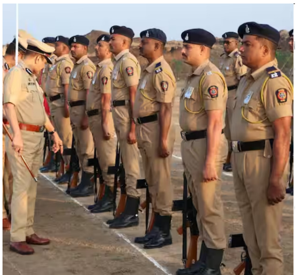
२ मे २०२६ रोजी आयोजित करण्यात आलेल्या लेखी परीक्षेत विचारण्यात आलेले प्रश्न हे एका खासगी प्रकाशकाच्या 'पोलीस भरती प्रश्नपत्रिका सराव प्रश्नसंच १०' या पुस्तकातून घेतल्याचा आरोप करण्यात आला होता. या पुस्तकातील १०० पैकी तब्बल

मुंबई : महाराष्ट्र पोलीस भरती प्रक्रियेसंबंधी मोठी बातमी समोर आली आहे. राज्य राखीव पोलीस दल गट क्रमांक ५, दौंड येथील सशस्त्र पोलीस शिपाई भरतीची लेखी परीक्षा अखेर रद्द करण्यात आली आहे. प्रश्नपत्रिकेतील १०० पैकी तब्बल ८५ प्रश्न एका खासगी प्रकाशन संस्थेच्या सराव प्रश्नसंचातून जसेच्या तसे घेतल्याचा आरोप झाल्यानंतर ही कारवाई करण्यात आली. आता २४ मे २०२६ रोजी नव्याने लेखी परीक्षा घेतली जाणार असल्याची माहिती पोलीस दलातील वरिष्ठ सूत्रांनी दिली आहे. ही परीक्षा दत्तकला शिक्षण संस्था, स्वामी विचोळी, दौंड येथे पार पडणार आहे. या संपूर्ण प्रकरणाचा पाठपुरावा एबीपी माझाने केला होता. त्यानंतर प्रशासनाने या गंभीर प्रकाराची दखल घेत भरती प्रक्रिया स्थगित केली होती. आता ती परीक्षा अधिकृतपणे रद्द करण्यात आली आहे.