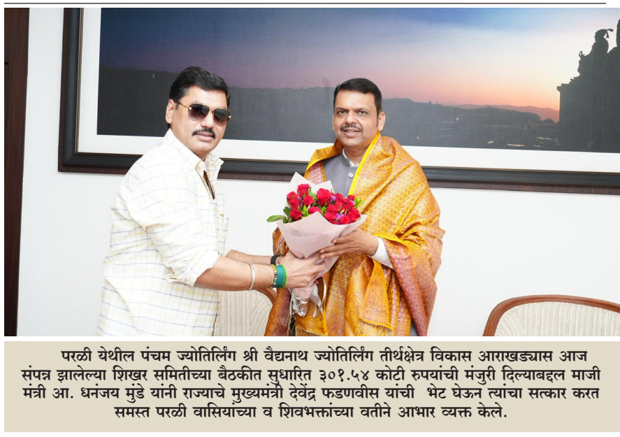
परळी येथील पंचम ज्योतिर्लिंग श्री वैद्यनाथ ज्योतिर्लिंग तीर्थक्षेत्र विकास आराखड्यास आज संपन्न झालेल्या शिखर समितीच्या बैठकीत सुधारित ३०१.५४ कोटी रुपयांची मंजूरी दिल्याबद्दल माजी मंत्री आ. धनंजय मुंडे यांनी राज्याचे मुख्यमंत्री देवेंद्र फडणवीस यांची भेट घेऊन त्यांचा सत्कार करत समस्त परळी वासियांच्या व शिवभक्तांच्या वतीने आभार व्यक्त केले.