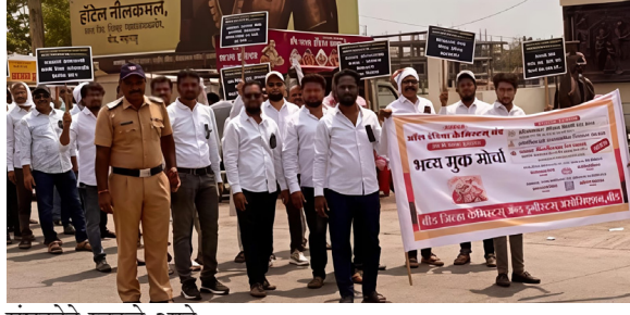
संघटनेने म्हटले आहे.

सरकार आणि प्रशासनाकडून अपेक्षित प्रतिसाद न मिळाल्याने अखेर देशव्यापी प्रतीकात्मक बंद पुकारण्याची वेळ आल्याचे