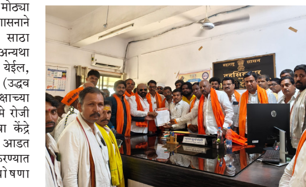
देगलूर प्रतिनिधी खरीप हंगाम तोंडावर आलेला असताना डीएपी, युरिया आदी रासायनिक खतांचा तीव्र तुटवडा निर्माण झाल्याने शेतकरी मोठ्या संकटात सापडला आहे. शासनाने तातडीने खतांचा पुरेसा साठा उपलब्ध करून द्यावा, अन्यथा आंदोलन तीव्र करण्यात येईल, असा इशारा देत शिवसेना (उद्धव बाळासाहेब ठाकरे) पक्षाच्या वतीने सोमवार दि. २५ मे रोजी देगलूर येथील कृषी सेवा केंद्रे तसेच मोठा बाजारातील आडत दुकाने बंद आंदोलन करण्यात येणार असल्याची घोषणा करण्यात आली आहे.

रासायनिक खतांचा तुटवडा दूर करा; अन्यथा देगलूर बंद - शिवसेना (ठाकरे)चा इशारा