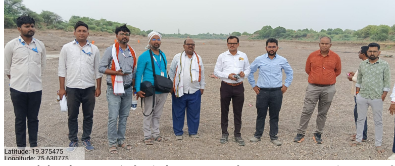
प्रशासनाचे गेवराई तहसीलदारांसमोर संपूर्ण प्रकार उघड करत संबंधितांवर कठोर कारवाईची मागणी केली. तसेच साष्टपिंपळगाव घाट क्रमांक २ येथील रेंती कंत्राटदाराने राक्षसभुवन परिसरातून विनापरवानगी रस्ता तयार करून रेंती चोरी केल्याचेही उघड झाले. अधिकाऱ्यांसमोरच मुजोरी व्हिडिओ पुरावे रवाना

लागू नये म्हणून सर्व अधिकारी आणि कर्मचारी अंबड येथील एपीएमसी आवारात गुप्तपणे जमा झाले. त्यानंतर खाजगी वाहनांतून वेगवेगळ्या मार्गांनी साष्टपिंपळगाव घाट क्रमांक १ आणि २ परिसराला चारही बाजूंनी वेढा घालण्यात आला. अचानक प्रशासनाचे पथक धडकताच तस्करांची एकच धावपळ उडाली. भूमी अभिलेख विभागाच्या तीन स्वतंत्र पथकांनी अत्याधुनिक ईटीएस तंत्रज्ञानाद्वारे नदीपात्रातील अंबड खड्ड्यांची अचूक मोजणी केली. या कारवाईत बीड जिल्हातील गेवराई प्रशासनालाही सहभागी करून घेण्यात आले होते. बीडच्या हद्दीतून अंबडमध्ये घुसखोरी बेकायदेशीर रस्त्याने वाळूची लूट कारवाईदरम्यान धक्कादायक प्रकार उघडकीस आला. गेवराई तालुक्यातील सावरगाव येथील टेंडरधारकाचे जालना जिल्ह्याची सीमा ओलांडून थेट अंबड तालुक्यातील गांधारी घाट परिसरात घुसखोरी केल्याचे प्रशासनाच्या निदर्शनास आले. एवढेच नव्हे तर बीडच्या बाजूने नदीपात्रात थेट बेकायदेशीर रस्ता तयार करून मोठ्या प्रमाणावर वाळूची वाहतूक सुरू असल्याचे स्पष्ट झाले. या गंधीर प्रकाराची नोंद घेऊन अंबड