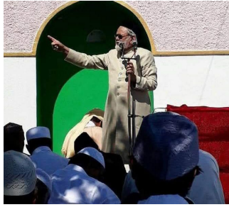
प्रभावी माध्यम आहे.

बेधडक व्यक्तिमत्त्व, न्यायासाठी लढणारा योद्धा आणि समाजातील एक तेजस्वी दीप हरपला