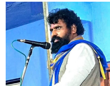
आयोजन करण्यात आले आहे. सामाजिक, शैक्षणिक व आरक्षण विषयक विविध मुद्द्यांवर या परिषदेत सखोल चर्चा होणार असून राज्यभरातील अनेक मान्यवर उपस्थित राहणार आहेत.