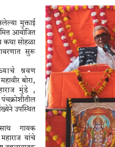
संपूर्ण परिसर सध्या रामभक्तीमध्ये तल्लीन झालेला दिसून येत आहे.