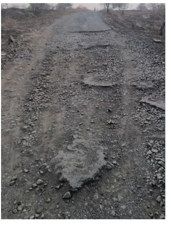
केले आहे. यापूर्वीही १५ डिसेंबर २०२५, १९ डिसेंबर २०२५ व २६ डिसेंबर २०२५ रोजी संबंधित