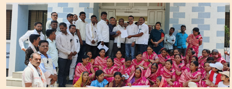
मौन मोर्चा न राहता भविष्यात संपूर्ण देशभर तीव्र आणि उग्र आंदोलन उभारले जाईल ज्याची संपूर्ण जबाबदारी प्रशासनाची असेल. या मौन जुलूमध्ये अंबड शहरातील सकल जैन समाजाचे अवालवृद्ध महिला,मुली आणि तरुण मोठ्या संख्येने काळ्या फिती लावून आणि निषेधाचे फलक हातात घेऊन सहभागी झाले होते.

राष्ट्रीय संत सुरक्षा धोरण केंद्र सरकारने तात्काळ राष्ट्रीय संत सुरक्षा धोरण लागू करावे.पायी विहार करणाऱ्या संतांसाठी विशेष सुरक्षा मार्गदर्शक तत्त्वे ड्रॉपतयार करण्यात यावीत. विशेष सुरक्षा प्रोटोकॉल महामार्गावर व संवेदनशील भागात संतांच्या विहारादरम्यान पोलिस संरक्षण वाहतूक नियंत्रण आणि चेंबराणी फलक लावण्यात यावेत. विशेष संवेदनशील श्रेणी संतांविरूद्ध होणाऱ्या गुन्हांना विशेष संवेदनशील श्रेणीत समाविष्ट करून जलदगती न्यायालयात खटले चालवावेत. तर देशभर तीव्र आंदोलन छेडणार प्रशासनाला गर्भित इशारा अंबड येथील सकल जैन समाजाने प्रशासनाला स्पष्ट शब्दांत इशारा दिला आहे की जैन संतांच्या सुरक्षेबाबत केंद्र व राज्य सरकारने तातडीने ठोस पावले उचलली नाहीत तर हा केवळ