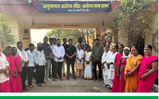
तज्ज्ञ डॉक्टरां यांच्या प्रयत्नाने ग्रामीण महिलांना मिळाला मोठा दिलासा