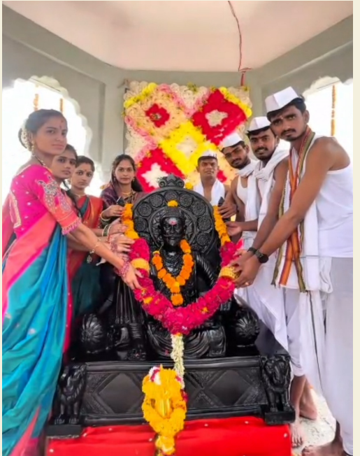
छत्रपती शिवाजी महाराज यांच्या पुतळ्याचे अनावरण सोहळा संपन्न