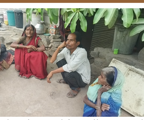
वस्तुस्थिती पाहिली तेव्हा अधिकारीही हेलावून गेले. ज्या जागेला घर म्हणणेही शक्य नव्हते अशा भंगारातील साहित्यापासून बनवलेल्या तातुल्या आडोशात हे कुटुंब राहत आहे. पावसाळ्यात या घरात चक्र १ ते २ फूट पाणी साचून राहते. या कुटुंबात दोन बहिणी आणि एक बहिणीचा मुका-बहिरा मुलगा अशा तीन व्यक्ती एकत्र राहतात. निसर्गाने या कुटुंबावर अत्यंत कठोर आघात केला आहे यातील एका बहिणीला कुष्ठरोगाची बाधा झालेली असून त्यांच्या हाता-पायाला एकही बोट शिल्लक नाही. भाजीपाला विकून हे कुटुंब आपला