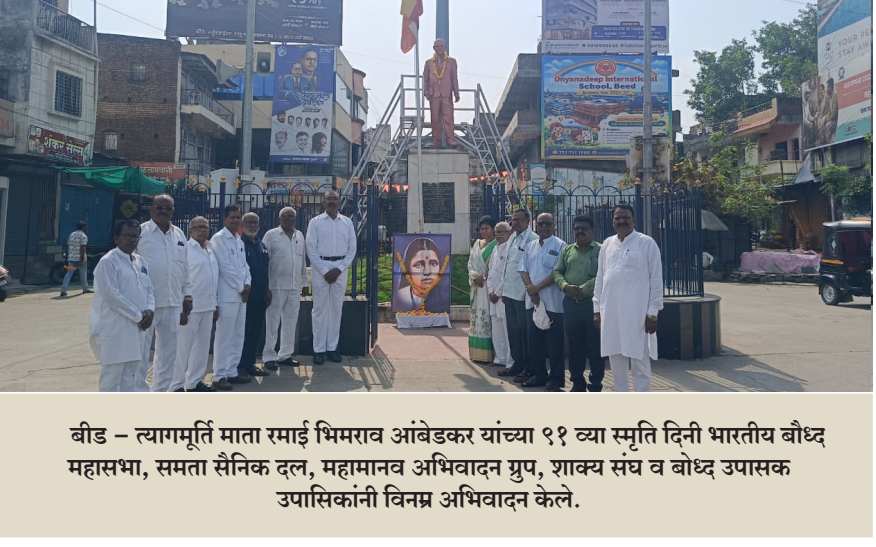
बीड - त्यागमूर्ति माता रमाई भिमवार आंबेडकर यांच्या ९१ व्या स्मृति दिनी भारतीय बौद्ध महासभा, समता सैनिक दल, महामानव अभिवादन गुप, शाक्य संघ व बोध उपासक उपासिकांनी विनम्र अभिवादन केले.