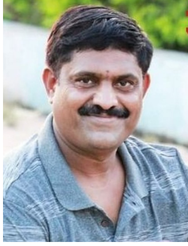
या संपूर्ण गैरव्यवहारात बबन निवृत्ती सपाटे आणि प्रकाश निवृत्ती सपाटे यांच्या नावावरील सामाईक क्षेत्राच्या ७/१२ वरून बेकायदेशीरपणे

प्राम झालेल्या धक्कादायक कागदपत्रांनुसार मौजे जामखेड येथील गट नं. ३४ मधील सामाईक क्षेत्र १ हेक्टर ६४ आर हे मूळतः शासकीय अटी-शर्तीच्या अधीन असलेले भोगवटदार वर्ग-२ स्वरूपाचे होते. सिलिंग कायद्यांतर्गत किंवा शासकीय वाटपातील अशा जमिनीचे वर्ग-१ मध्ये रूपांतर करण्यासाठी शासनाची पूर्वेपरवानगी आणि कडक कायदेशीर प्रक्रियेचे पालन करणे अनिवार्य असते.