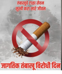
जागतिक तंबाखू विरोधी दिन

निकोटीनवर आधारित गंभीर व्यसन आहे. गुठ्खा, जर्दा, पानमसाला, मावा, सुगारी व इतर तंबाखूजन्य पदार्थांच्या वाढत्या सेवनामुळे भारतात तोंडाच्या उघडताना त्रास किंवा अन्न गिळताना वेदना यांसारखी लक्षणे दिसू शकतात. या लक्षणांकडे दुर्लक्ष केल्यास प्री-कॅन्सर अवस्थेचे रूपांतर कर्करोगात होऊ शकते. त्यांनी सांगितले की, भारतात सुमारे २५ कोटी लोक तंबाखूचे सेवन करतात, तर महाराष्ट्रात जवळपास २.५ कोटी लोक तंबाखूच्या व्यसनाधीन आहेत. संशोधनानुसार तोंडाच्या कर्करोगाच्या सुमारे ७० टक्के प्रकरणांचा थेट संबंध तंबाखू सेवनाशी आहे. तंबाखूचे दुष्परिणाम केवळ कर्करोगापुरते मर्यादित नसून धूम्रपानामुळे फुफ्फुसांचे विकार, श्वसनास त्रास, हृदयविकार, उच्च रक्तदाब व पक्षाघाताचा धोकाही वाढतो.