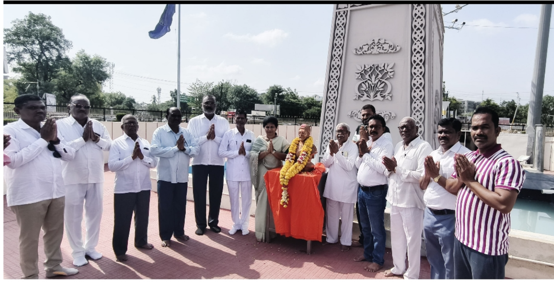
बीड - ६ जून रविवार रोजी सकाळी कुळवाडी भूषण छत्रपती शिवाजी महाराज यांच्या ३५२ वा. राज्याभिषेक सोहळा दिनी महामानव अभिवादन गुप बीड महाराजांना विनम्र अभिवादन करताना.