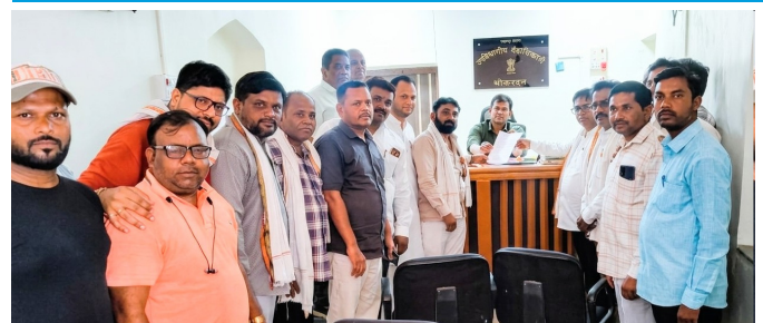
हल्ल्यामुळे जिल्ह्यातील पत्रकारांमध्ये भीतीचे वातावरण आहे. त्यामुळे हल्ल्यामागील सर्व आरोपींचा तात्काळ शोध घेऊन त्यांच्यावर पत्रकार संरक्षण कायदांतर्गत गुन्हा दाखल करून कठोर कायदेशीर कारवाई करावी, अशी ठाम मागणी संघाने केली. तसेच या प्रकरणाची सखोल चौकशी करून दोषींना कठोर शिक्षा