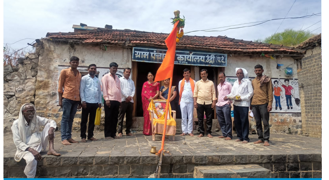
मुखेड - हिंदवी स्वराज्याचे संस्थापक, रयतेचे राजे, छत्रपती शिवाजी महाराज यांच्या राज्याभिषेक दिनानिमित्त ग्रामपंचायत कार्यालय उद्री प.दे. ता. मुखेड येथे शिवराज्याभिषेक सोहळा उत्साहात साजरा करून विनम्र अभिवादन करण्यात आले.