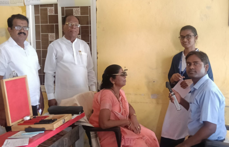
धर्माबाद / अशोक पडोळे

तालुक्यातील मौजे बाभळी बंधारा येथे तेलंगानातील मुधोल येथील एल.व्ही.प्रसाद नेत्र रुग्णालयाच्या वतीने दि. ९ जून २०२६ मंगळवारी मोफत नेत्र तपासणी व मोतीबिंदू शस्त्रक्रिया शिबीर घेण्यात आले. यास नागरीकांनी उत्स्फूर्त प्रतिसाद दिला असून एकूण १५१ रुग्णांच्या डोळ्यांची तपासणी करण्यात आली असून त्यापैकी ३९ रुग्ण मोतीबिंदू शस्त्रक्रिया तर १८ रुग्णांच्या डोळ्यांवरील मांस आल्यामुळे होणारी मोफत शस्त्रक्रियेसाठी पात्र ठरले आहेत. शस्त्रक्रियेसाठी रुग्णांना घेऊन जाण्यासाठी नेत्र रुग्णालयाच्या वतीने सोय करण्यात आली आहे. या मोफत नेत्र तपासणी व शस्त्रक्रिया शिबीराचे आयोजन मराठी पत्रकार संघाचे जिल्हाउपाध्यक्ष जी.