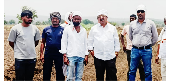
आता कच्च्या रस्त्याचे सिमेंट काँक्रीट रस्त्यात रूपांतर करण्यासाठी शासनाने सहकार्य व संरक्षण द्यावे

दिधी उभारला. या निधीतून जेसीबीच्या सहाय्याने रस्त्याचे अर्थवर्क पूर्ण करण्यात आले. सध्या हा रस्ता कच्च्या स्वरूपात तयार करण्यात आला असला तरी पावसाळ्यात चिखल, पाण्याचा निचरा आणि वाहतुकीच्या अडचणी निर्माण होण्याची शक्यता आहे. त्यामुळे भविष्यात या रस्त्याचा पूर्ण लाभ मिळण्यासाठी त्याचे सिमेंट काँक्रीट रस्त्यात रूपांतर करणे अत्यावश्यक असल्याचे शेतकरी सांगत आहेत. शेतकऱ्यांनी स्वखर्चाने आणि स्वतःची जमीन देऊन शासनाने लाघो रूपये वाचवले आहेत. त्यामुळे शासनानेही या लोकसहभागाची दखल घेऊन सदरील रस्त्याच्या सीसी रस्त्याच्या कामाला प्रशासकीय मान्यता द्यावी, आवश्यक निधी