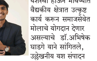
कल्याणबद्दल, मराठा आंदोलक मनोज जरांगे पाटील यांनी याशोचित सन्मान करण्यात आला आहे.