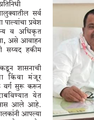
असल्याचा इशाराही त्यांनी दिला आहे.

तसेच, मान्यतेच्या अटींचे उल्लंघन करणाऱ्या किंवा मंजूर वर्गापेक्षा अधिक वर्ग चालविणाऱ्या शाळांवर संबंधित नियमांनुसार कठोर प्रशासकीय कारवाई करण्यात येणार