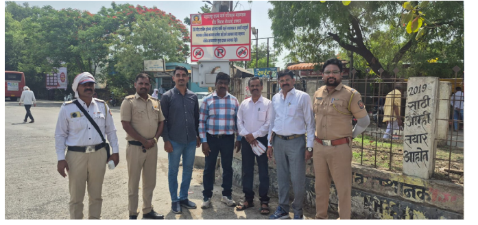
महाराष्ट्र राज्य परिवहन मंडळ व वाहतूक पोलीसांच्या वतीने

स्वच्छता, क्रीडा साहित्य, पोषण शक्ती निर्माण योजना, विविध स्पर्धा परीक्षा आणि शाळांमधील भौतिक सुविधांचा आढावा घ्यावा, असे स्पष्ट करण्यात आले आहे. याशिवाय शाळांमधील आवश्यक सुविधा उपलब्ध करून देण्यासाठी संबंधितांना मार्गदर्शन करणे आणि शाळेच्या सुविधांचे अंमलबजावणीसाठी उपाययोजना सुचविणे अपेक्षित आहे. १०० शाळांना भेटी या उपक्रमांतर्गत दिलेल्या शाळांना भेटीचा सविस्तर अहवाल तयार करून संबंधित गटशिक्षणाधिकाऱ्यांनी एकत्रित स्वरूपात जिल्हा कार्यालयात सादर करावा, असे निर्देश देण्यात आले आहेत. जिल्हास्तरीय अधिकाऱ्यांचे अहवालही यासोबत जोडण्यास सांगण्यात आले आहे. शाळेची वेळ सकाळी १० ते सायंकाळी ४.३० अशी निश्चित करण्यात आली असून संपूर्ण जिल्हात शाळा प्रवेशोत्सव मोठ्या उत्साहात आणि लोकसहभागाने साजरा करण्यासाठी प्रशासनाने व्यापक तयारी सुरु केली आहे.