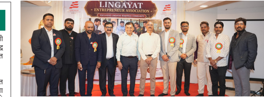
लिंगायत एंटरप्रेन्स्युअर असोसिएशनच्या वतीने नाशिकमध्ये