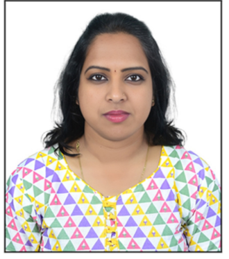
परंपरा नाही; ती आपली संस्कृती आहे, आपली ओळख आहे.

आपल्या संस्कृतीने आपल्याला शिकवलं आहे 'मातृ देवो भव, पितृ देवो भव. सकाळी उठल्यावर आई-वडिलांना नमस्कार करणं, त्यांची विचारपूस करणं, त्यांच्या अनुभवांचा आदर करणं ही केवळ