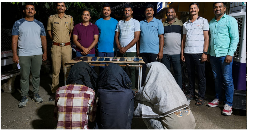
प्रमाणे गुन्हा दाखल झाला होता.