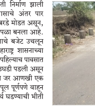
गुतेदाराने शासनाच्या तोंडाला फासले काळे पहिल्याच पावसात पूल ढासळल्याने संताप आंदोलनाचा इशारा