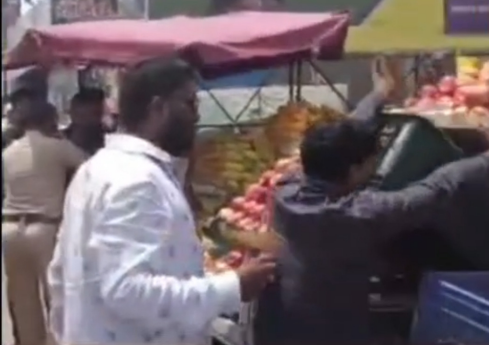
बीड - नगर रोड वरील मुजोर अतिक्रमणधारकांनी नियमाद्वारा वेळोवेळी अतिक्रमण हटवणाऱ्या पोलिसांना आणि नगरपालिका प्रशासनाला बदनाम करण्यासाठी स्वतःच फळे रस्त्यावर फेकून त्यांनीच पोलीस आणि प्रशासनाचे अतिक्रमणकार्ये भ्रामयले. हे दृष्टीत व्हिडिओमध्ये स्पष्ट झाले आहे. जे छायाचित्रांमध्ये ही दिसत आहे.