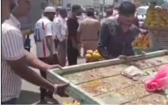
बीड - अतिक्रमण धारकांनी स्वतःचेच फुट पायदळी तुडवून हातागाडे रस्त्यावर फेकत अक्षरशः तमाशा केला. पोलीस आणि नगरपालिका प्रशासनावर दहशत निर्माण करण्याचा प्रयत्न देखील केला. हा एक प्रकारे अतिरेक झालेला आहे.

व्हिडिओ चित्रीकरण केले होते. यामध्ये विक्रेते स्वतःच गाड्या पलटवून फळे फेकत असल्याचे स्पष्ट दिसत आहे. हा खोटेपणा उघड झाल्यानंतर, शहरातील अनेक सामाजिक कार्यकर्त्यांनी आणि नागरिकांनी घटनास्थळी येऊन या धडक कारवाईचे जाहीर समर्थन केले आणि कर्तव्यदक्ष पोलीस प्रशासनाचे स्वागत केले. बीड शहराला कॅडीमुक्त आणि सुरक्षित करणे हे आमचे कर्तव्य आहे. अशा कोणत्याही खोटेबातम्यांना, अपवांना किंवा दबावतंत्राला प्रशासन बळी पडणार नाही. शासकीय कामात अडथळा आणणाऱ्यांवर आणि बदनामी करणाऱ्यांवर कडक कायदेशीर गुन्हे दाखल केले जातील. वाहतूकीस अडथळा ठरणाऱ्या अतिक्रमणधारकांविरुद्ध ही मोहीम अशीच तीव्रतेने सुरू राहील.