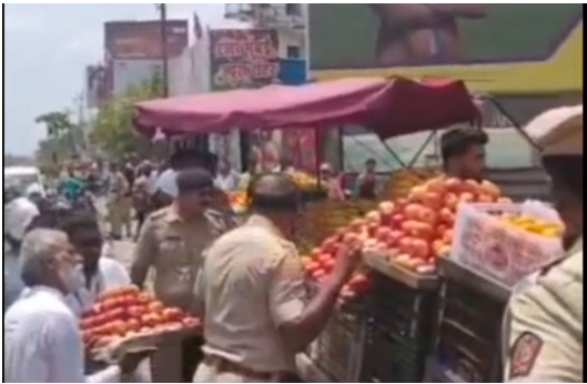
बीड - नगरपालिकेच्या सूचनेनुसार शहर वाहतूक शाखेचे पोलीस आणि नगरपालिकेचे कर्मचारी रस्त्यावरील अतिक्रमण करणाऱ्या फळ विक्रेत्यांना अतिक्रमण काढण्यासंदर्भात फक्त विनंती करत होते. हे छायाचित्रात स्पष्टपणे दिसत आहे.

बीड प्रतिनिधी नगर नाका चौकात बीड- अहिल्यानगर महामार्गावर नगर परिषद व वाहतूक शाखेच्या वतीने अनधिकृत अतिक्रमणांवर धडक कारवाई करण्यात आली. वारंवार सूचना देऊनही रस्ता न सोडणाऱ्या मुजोर फळ विक्रेत्यांनी कायदेशीर कारवाई टाळण्यासाठी व प्रशासनावर दबाव आणण्यासाठी स्वतःच्या हातांनी आपल्याच गाड्या रस्त्यावर उलटवल्या आणि गोंधळ घातला. यानंतर रस्त्यावरील सांडलेल्या फळांचे फोटो सोशल मीडियावर पसरवून प्रशासनाला बदनाम करण्याचा खोटा कांगावा केला. सामाजिक कार्यकर्त्यांनी उघड केले सत्य घटनास्थळी उपस्थित असलेल्या सजग सामाजिक कार्यकर्त्यांनी या संपूर्ण प्रकाराचे